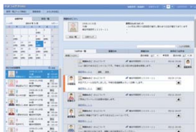
音声つぶやきSNS PCブラウザ画面