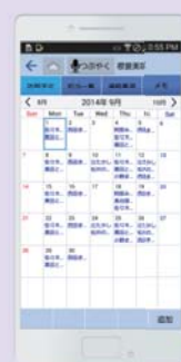
訪問予定カレンダー