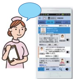
音声つぶやきスマートフォン アプリケーション